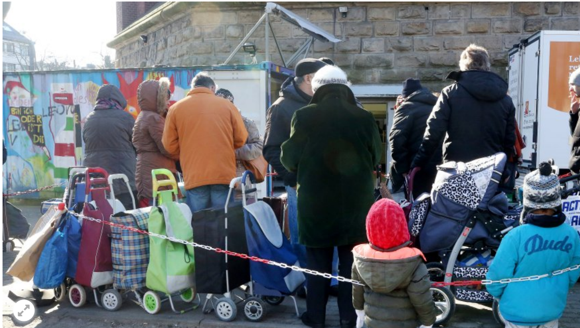
Warteschlange an der Essener Tafel

Der Aufnahmestopp für Ausländer bei der Essener Tafel hat eine Debatte über Armut ausgelöst. Nun wenden sich die Tafeln an die künftige Bundesregierung - und fordern "eine sozial-ökologische Wende".